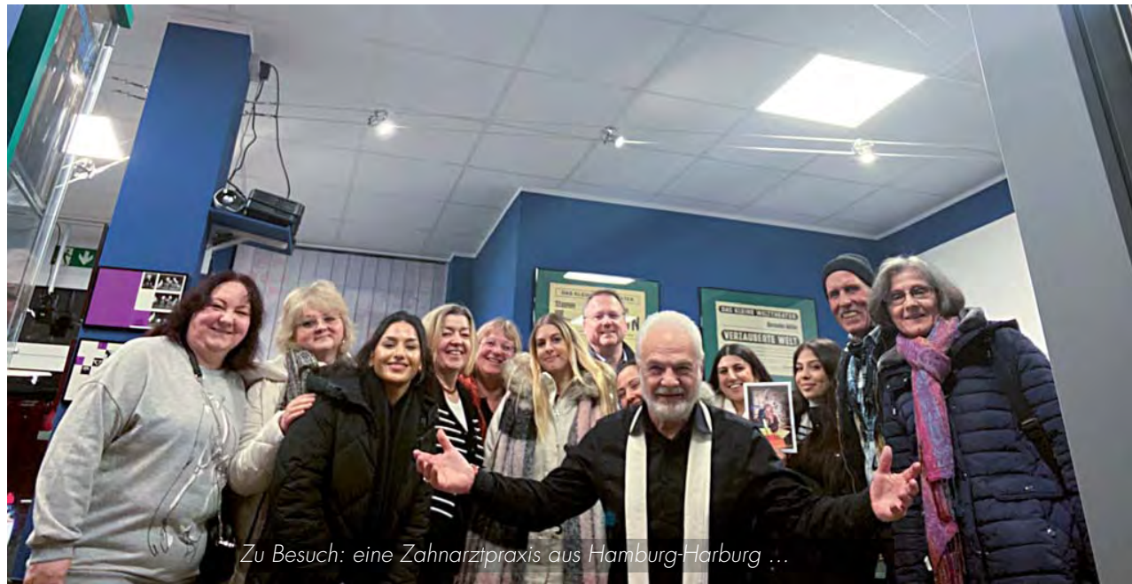
Zu Besuch: eine Zahnarztpraxis aus Hamburg-Harburg ...