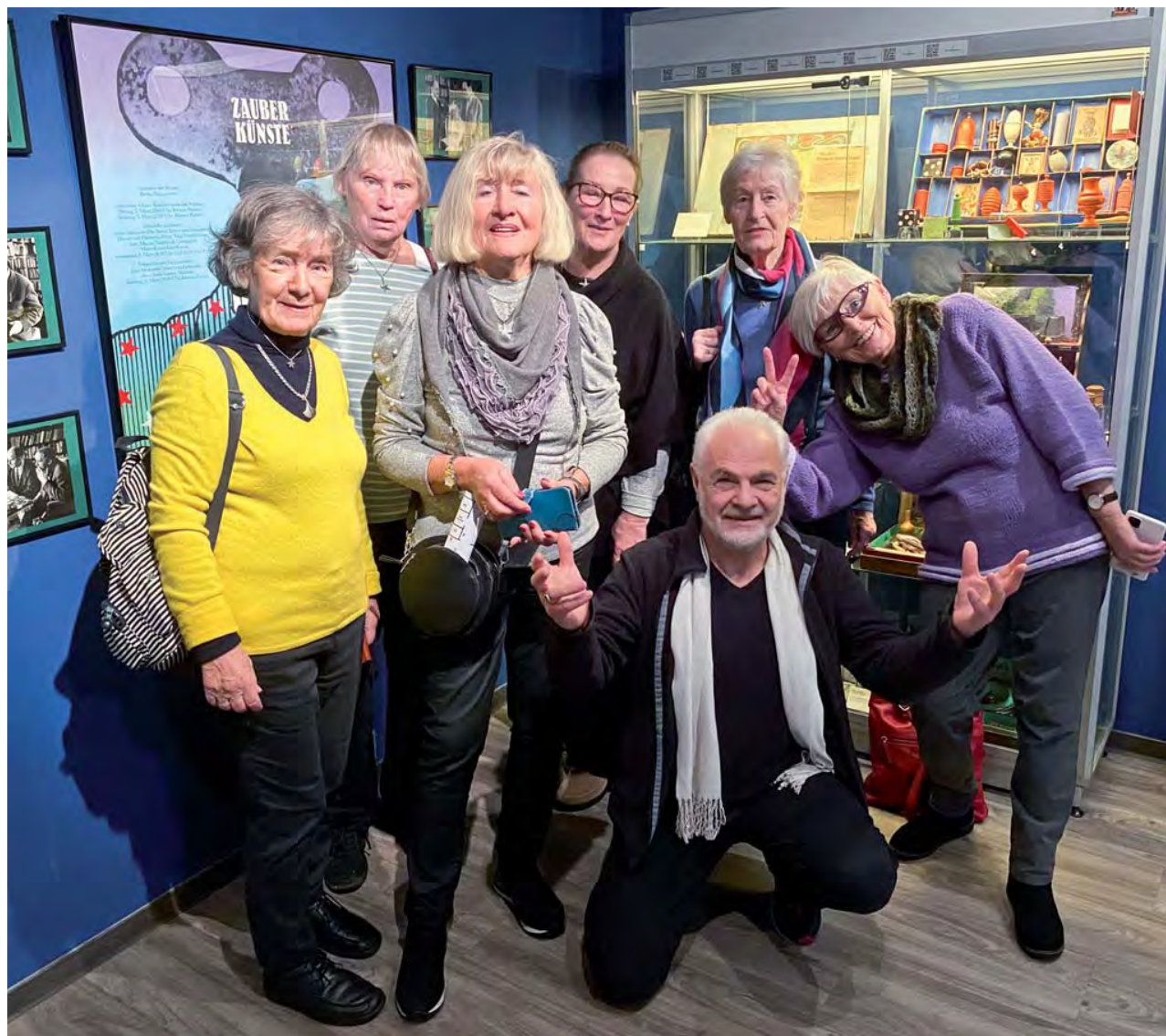
Auch „kleinere“ Gruppen (ab 6 Personen) haben Freude an einer Führung durch das Museum Bellachini