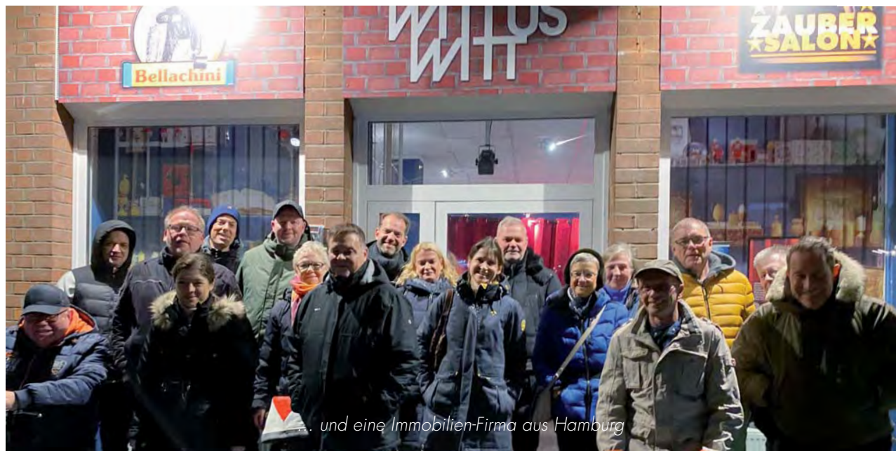
... und eine Immobilien-Firma aus Hamburg